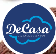
Trufas de chocolate