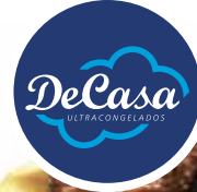
Carrillada de cerdo confitada