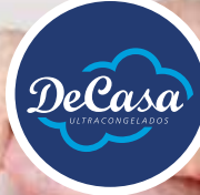
Alas de pollo partidas sin punta