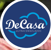
Chuletas de cordero Nacional mixtas (palo, riñonada y pierna)