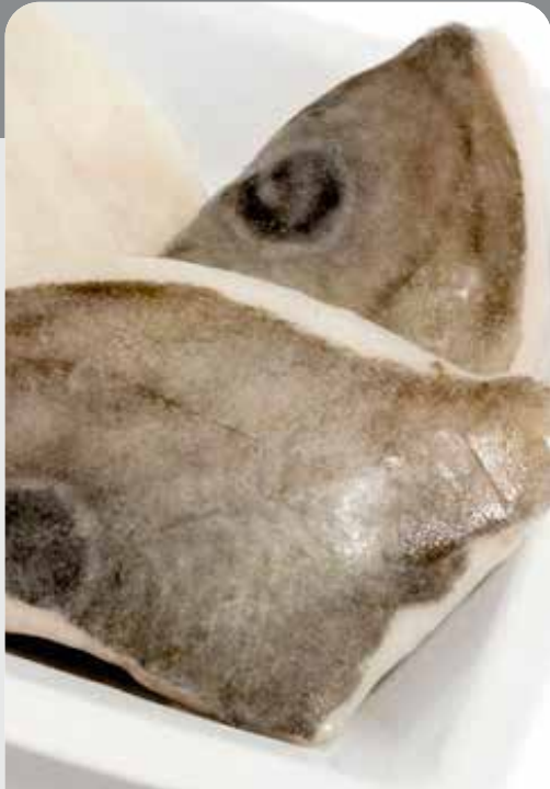
Filete de gallo pez de San Pedro

150/200 Bolsa 800 gr. neto, caja 6 bolsas