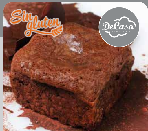
Brownie de chocolate