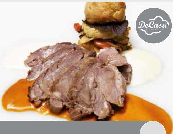
Carrillada de temera confitada