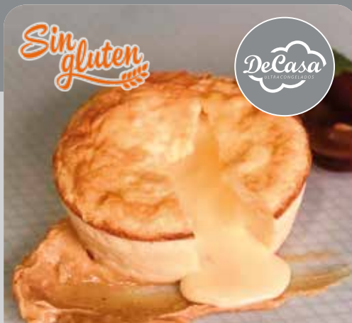
Couland de chocolate blanco