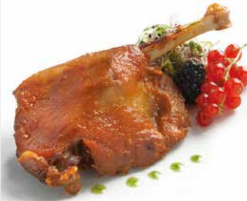
Muslos de pato confitados