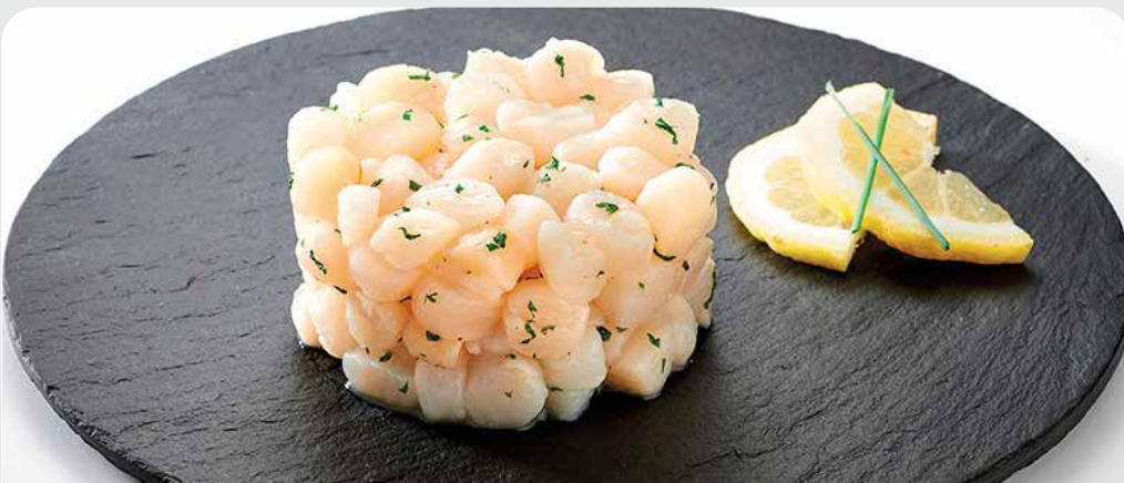
Tartar de vieiras