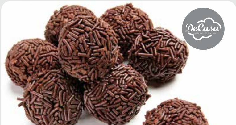
Trufas de chocolate