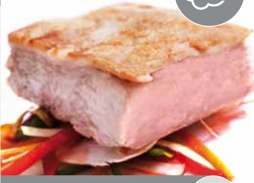
Cochinillo confitado deshuesado

Porciones 160 gr. aprox., caja 20 unidades