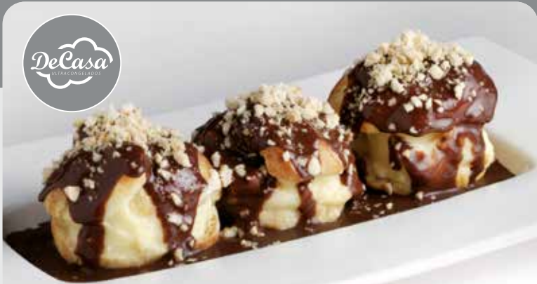
Profiteroles de nata