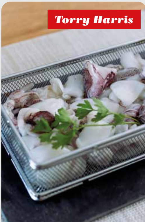
Calamar y sepia troceada