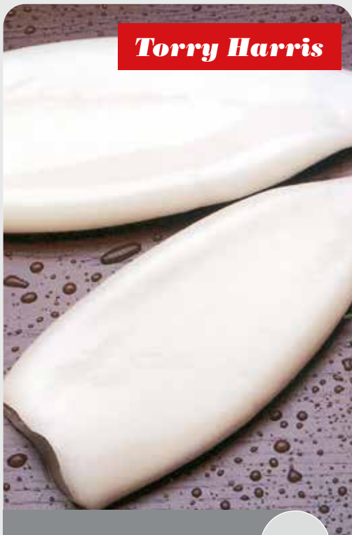
Tubo de pota U/5