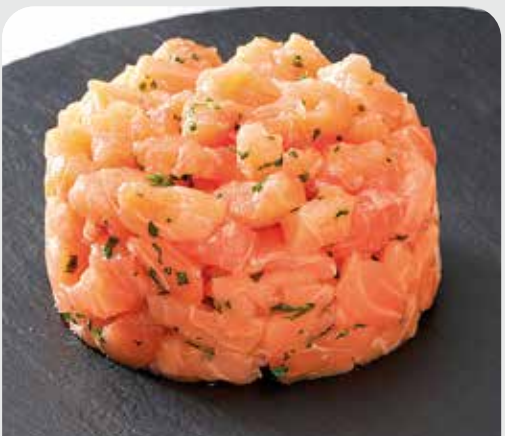
Tartar de salmón