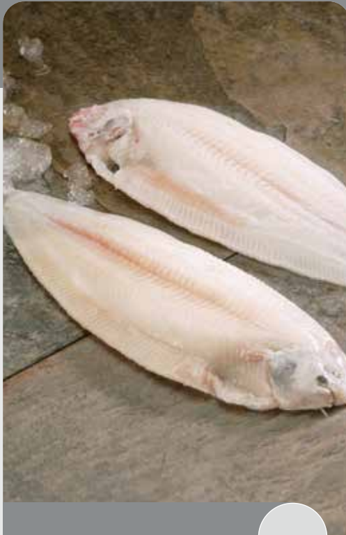
Lenguado Holandés Sin piel, 30%