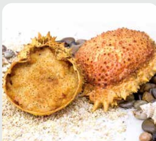
Centolla o centollo relleno