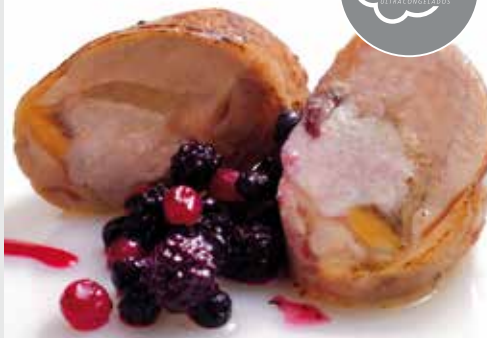
Pintada rellena de foie, ciruelas y manzanas