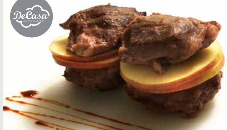
Carrillada de cerdo confitada