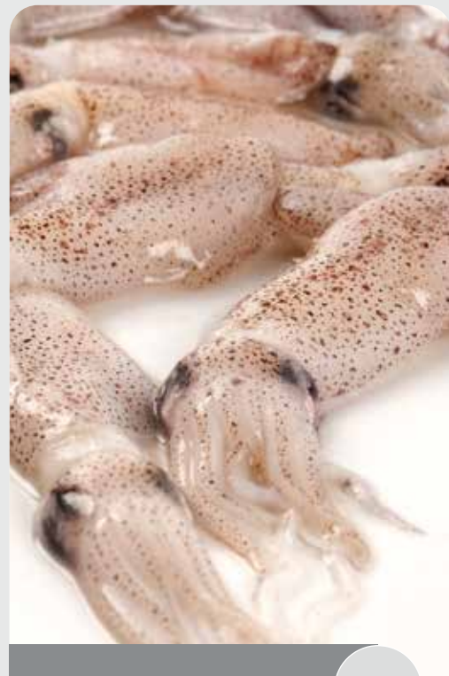
Puntilla china limpia, Sin pluma