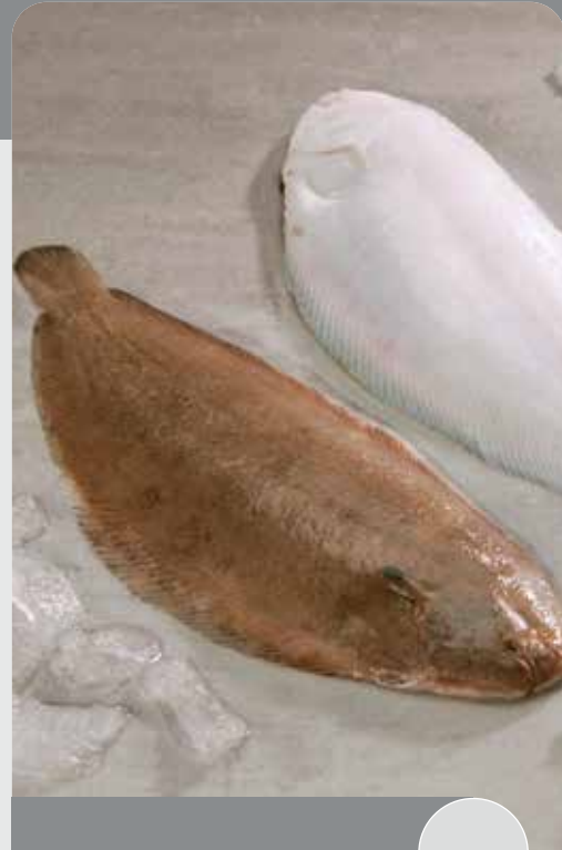
Lenguado Holandés Con piel, 30%