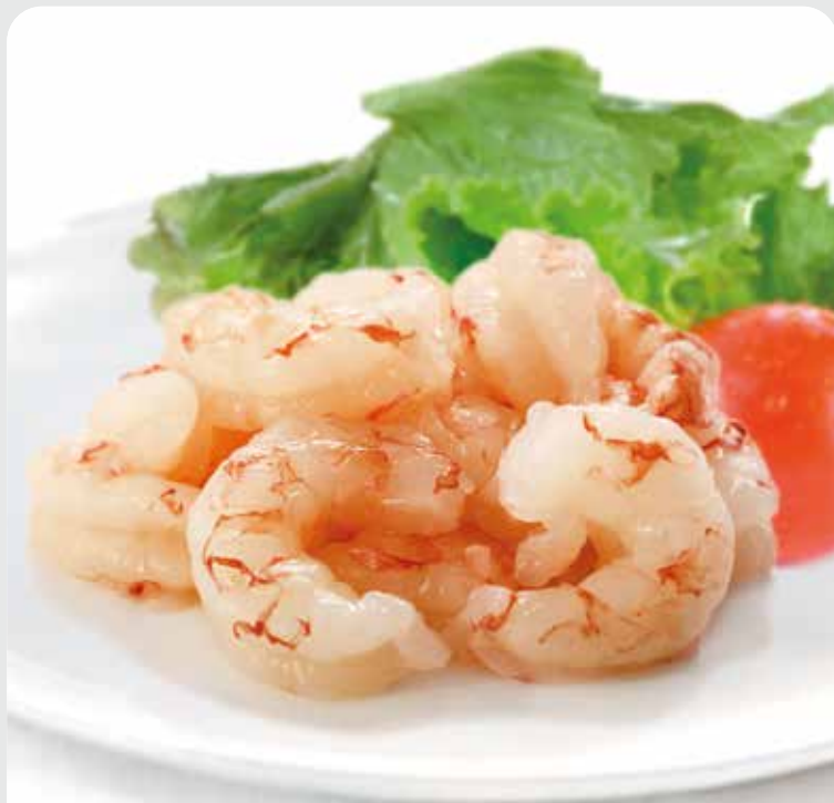
Cola de gambón pelado

60 pzas. aprox bolsa 900 gr. neto, caja 3 bolsas