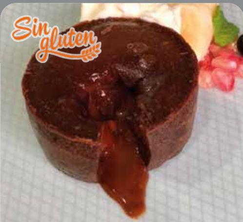
Couland de chocolate