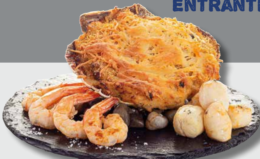
Vieira Suprema con langostinos