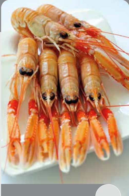
Cigala N°0 1250 gr. neto