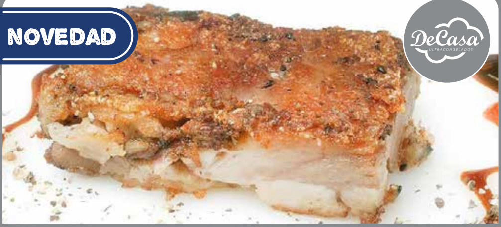
Placa de codillo de cerdo crujiente deshuesado