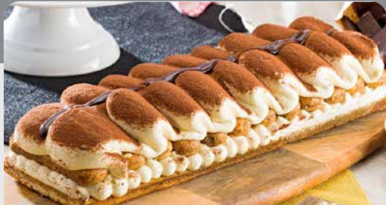
Tarta tiramisú rectangular