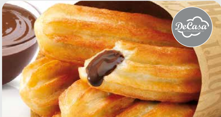
Churros rellenos de chocolate